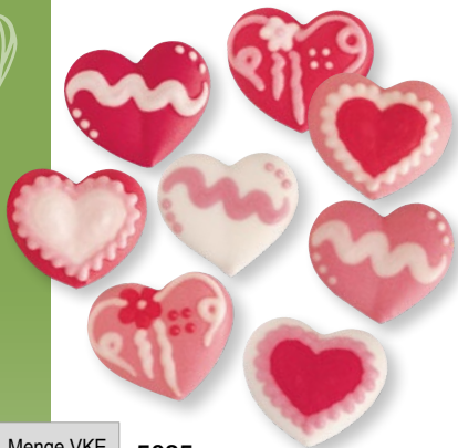
Menge VKE 5035 Zucker-Herzen, klein, sortiert 33 x 30 x 7 mm 96 Stück € 22,50