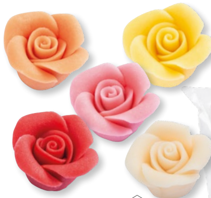
Menge VKE 30324 Marzipan-Rosen klein, sortiert / Ø 27 x 18 mm 48 Stück € 34,20