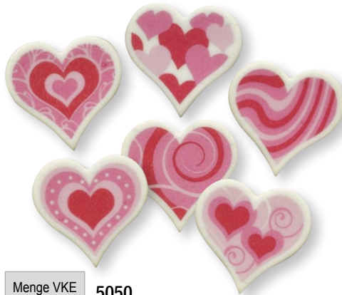
Menge VKE 5050 Herzen, klein, sortiert, Dekormasse / 36 mm 60 Stück € 10,85