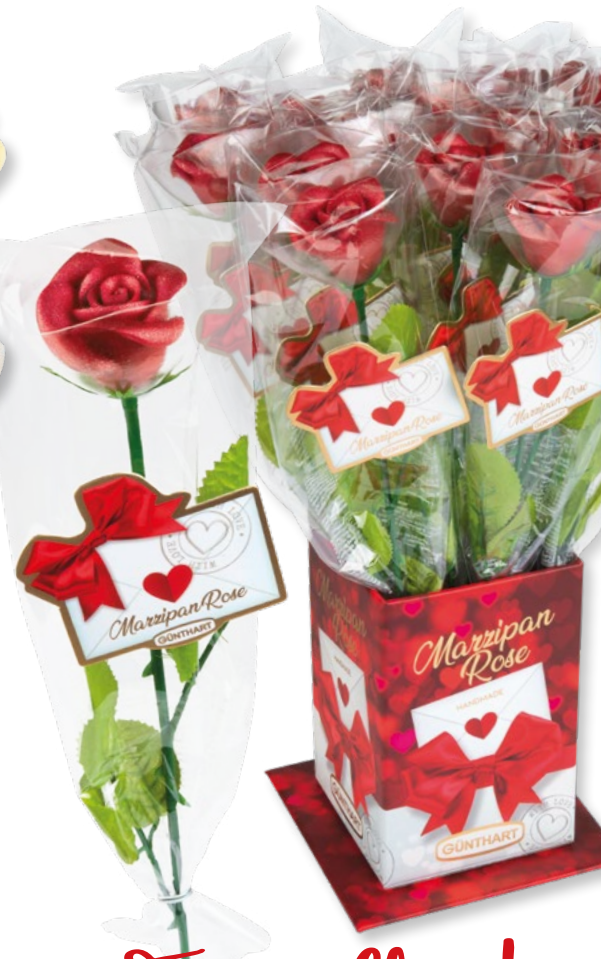
Menge VKE 5774 Rote Marzipan-Rose "Elegance" ~50 x 420 mm (Rose) 20 Stück € 69,20