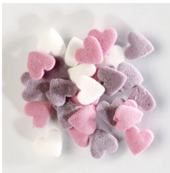
Menge VKE 4209 Streudekor, Zucker-Herzen bunt 7 mm / 1,5 kg € 21,90